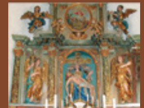
podružnica Veliki Slatnik