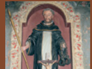
podružnica Gotna vas