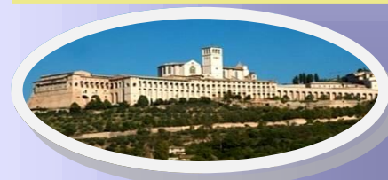
Assisi Sv. Frančišek