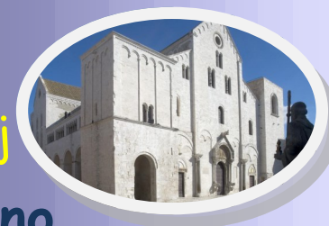
Bari Sv. Nikolaj