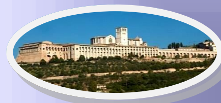
Assisi Sv. Frančišek